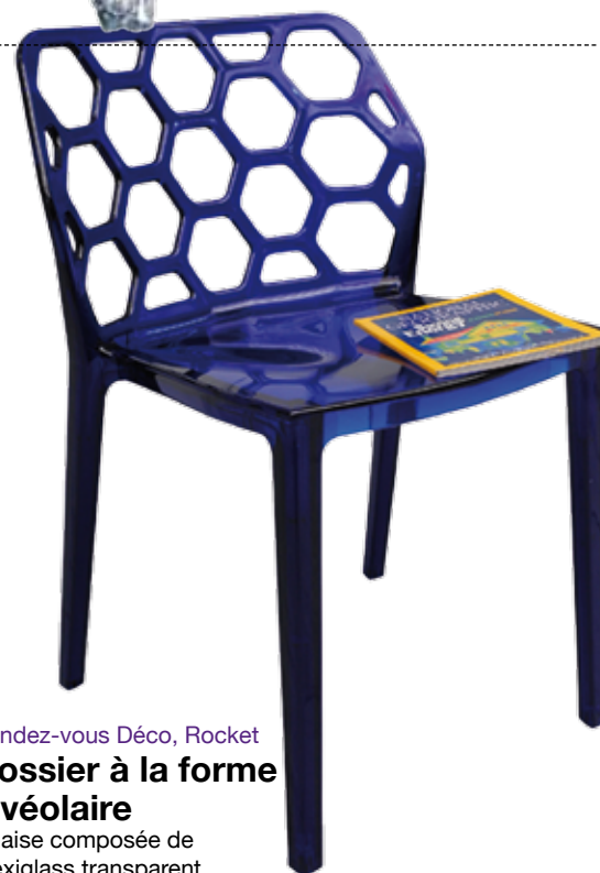
Rendez-vous Déco, Rocket Dossier à la forme alvéolaire Chaise composée de plexiglass transparent. Prix : 179 €

« J'aime les formes accueillantes et généreuses de ce fauteuil créé et imaginé par le talentueux designer Marcel Wanders. En proposant toute une gamme de couleurs, le fauteuil cyborg est un élégant mélange d'opacité et de transparence. Opaques, son assise et ses pieds en polycarbonate forment une base solide et confortable. Avec son harmonieux mouvement de courbure, son dossier transparent devient un élément dématérialisé, comme suspendu dans l'espace avec grâce et légèreté. Contemporain dans sa conception, un clin d'œil au classicisme d'un fauteuil Régence lui donne un petit côté majestueux et chic décalé. Au-delà de sa prouesse technique, je trouve que ce fauteuil est également une remarquable réalisation stylisée et esthétique. Il prendra place dans votre intérieur avec raffinement et élégance mais aussi à l'extérieur, sur votre terrasse, dans votre jardin ou près de la piscine. »