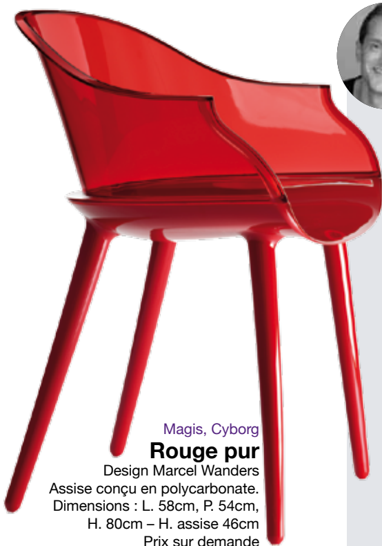
Magis, Cyborg Rouge pur Design Marcel Wanders Assise conçue en polycarbonate. Dimensions : L. 58cm, P. 54cm, H. 80cm – H. assise 46cm Prix sur demande