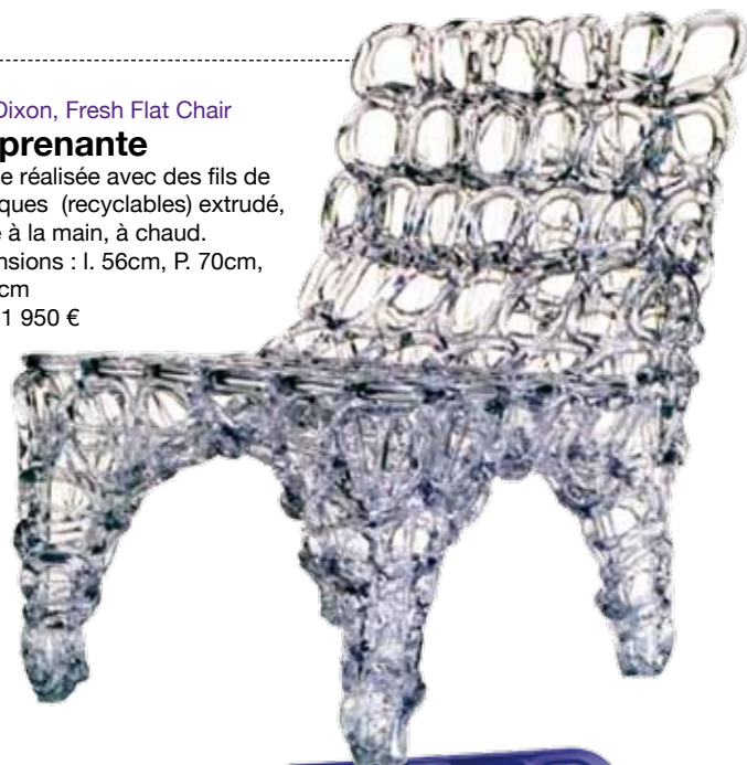
Tom Dixon, Fresh Flat Chair Surprenante Chaise réalisée avec des fils de plastiques (recyclables) extrudés, formés à la main, à chaud. Dimensions : L. 56cm, P. 70cm, H. 70cm Prix : 1 950 €