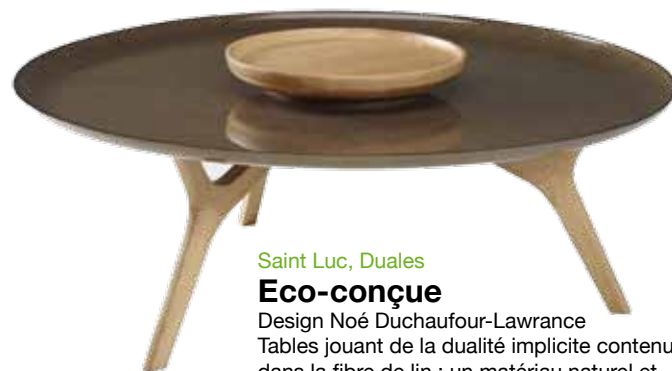
Table en panneau MDF laqué. Le client choisit sa propre combinaison de motifs, de couleurs et de formes. Dimensions : H. 42cm, diamètre 65cm ou H. 50cm, diamètre 65cm Prix : entre 397 € et 462 €