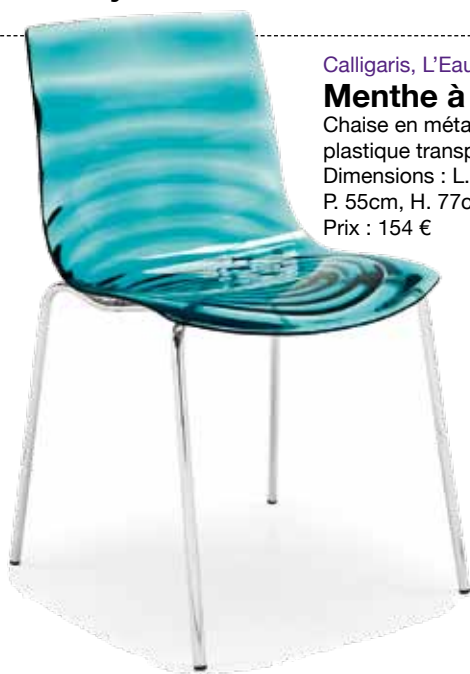
Calligaris, L'Eau Menthe à l'eau... Chaise en métal chromé et plastique transparent. Dimensions : L. 55cm, P. 55cm, H. 77cm Prix : 154 €

De la légèreté, de l'allure, un design pur, une modernité sans égale... les qualificatifs sont nombreux pour désigner ces chaises qui jouent la transparence et qui s'adaptent à tous les styles de déco. En 2002, Philippe Starck lança la chaise translucide Louis Ghost chez Kartell. Depuis lors, de nombreux designers ont surfé sur la vague. C'est parti pour une sélection haute en style !